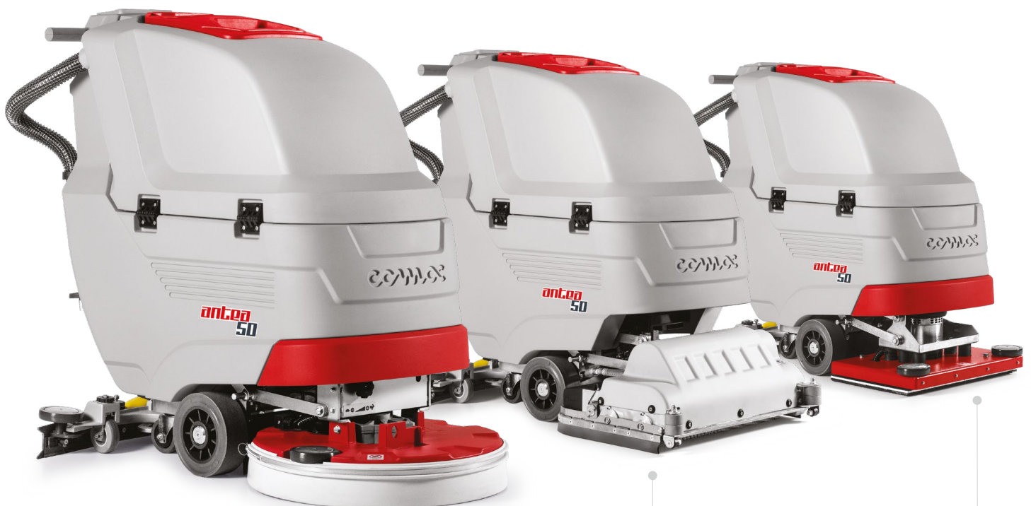
ANTEA 50 E/B/BT Version Bürstenkopf mit Tellerbürsten