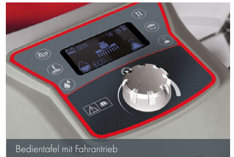
Bedientafel mit Fahrtrieb

Die antriebslose Ausführungen (Antea 50 E/B) sind mit einer einfachen und intuitiven Bedientafel ausgestattet.