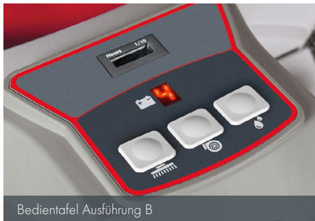
Bedientafel Ausführung B