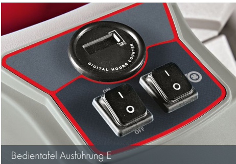
Bedientafel Ausführung E